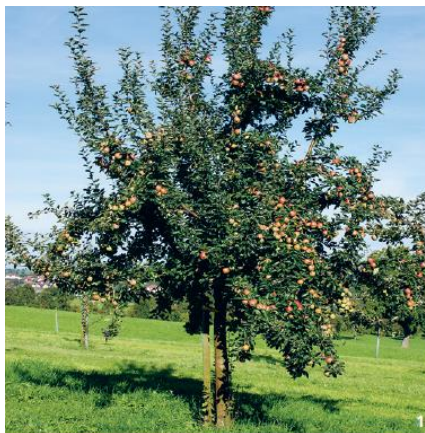
A gauche, verger ; à droite, arbre fruitier haute tige