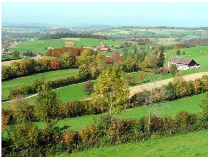
A gauche, allée d'arbres ; à droite, haies