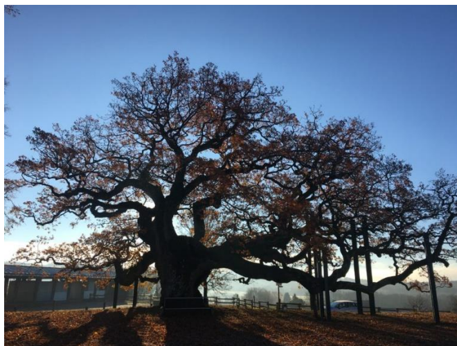
A gauche, arbre isolé ; à droite : arbre remarquable (chêne de Morrens)