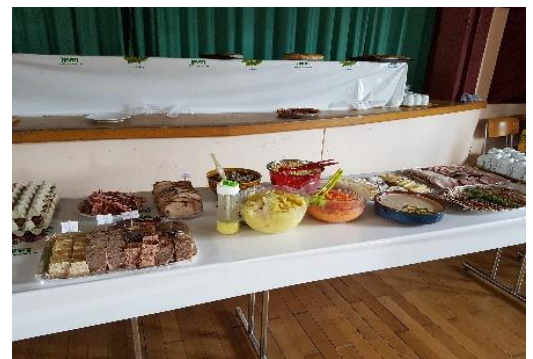
Brunch campagnard du 17 mars 2019

La société organise également une activité durant laquelle la population est la bienvenue. Pendant longtemps c'était un loto familial et, depuis deux ans, c'est un brunch campagnard. Nous serions heureux d'y accueillir les nouveaux habitants et de leur faire déguster des produits faits maison.