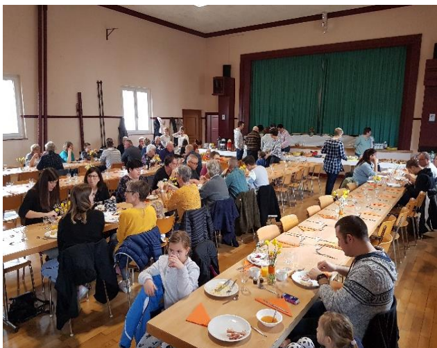
Brunch campagnard du 17 mars 2019

Toute personne féminine du village peut faire partie de cette société qui organise une à deux sorties en car par année. Ces sorties sont l'occasion de se retrouver pour discuter, pour passer un moment convivial et surtout pour se laisser porter tout au long d'une journée récréative, loin des enfants et des obligations du quotidien.